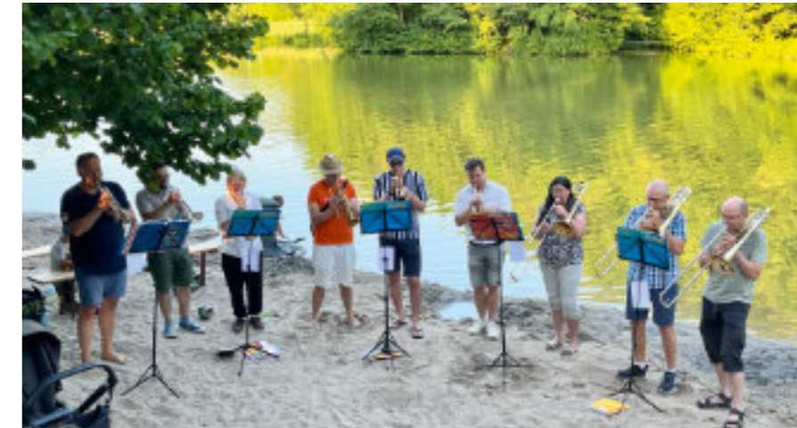
Der Posaunenchor hat den Gottesdienst zum Johannistag musikalisch am Strand des Mühlbacher Sees begleitet.