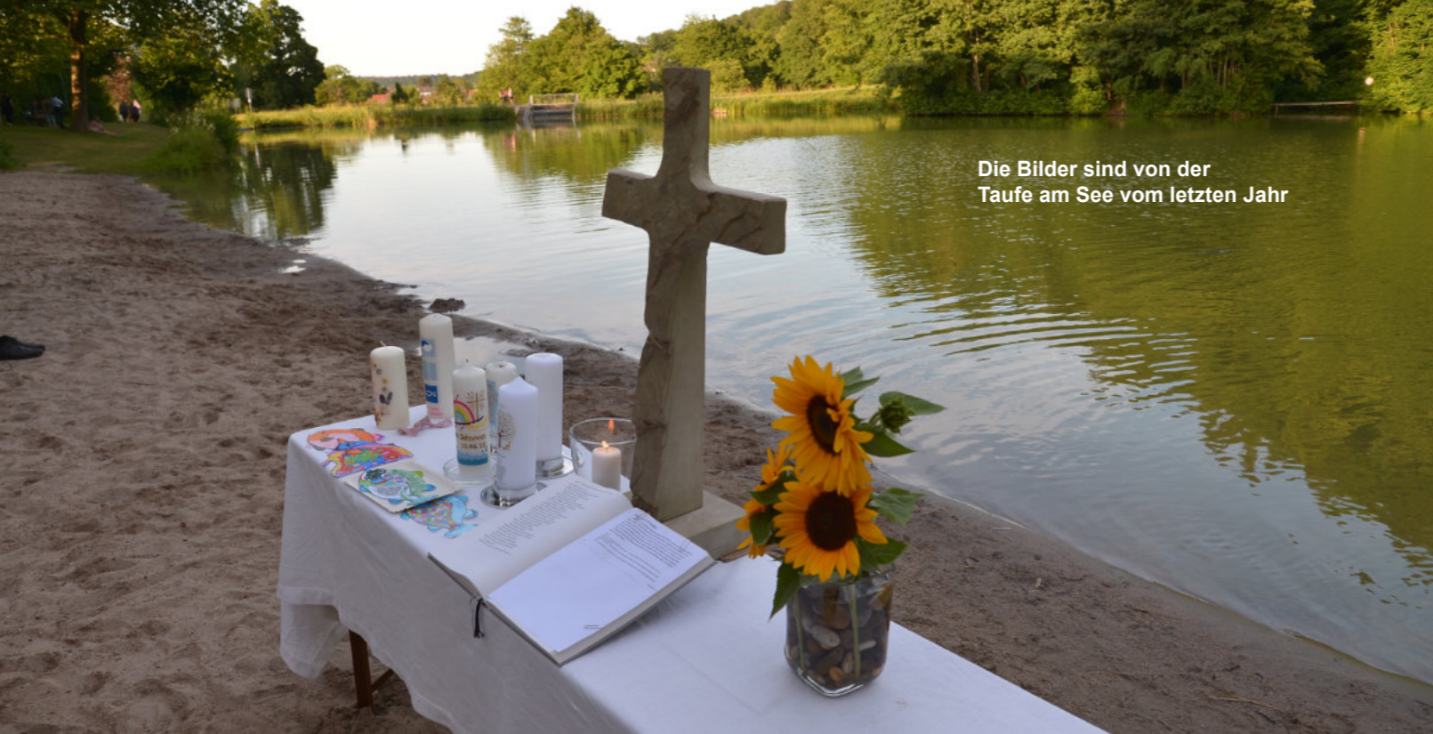
Die Bilder sind von der Taufe am See vom letzten Jahr