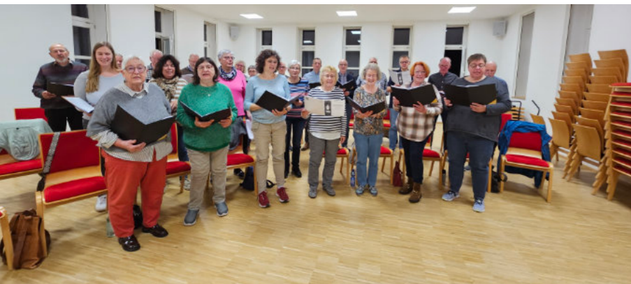
Kirche Mühlbach mit dem Ev. Kirchenchor, Ev. Posaunenchor und dem Musikverein Mühlbach. Herzliche Einladung!