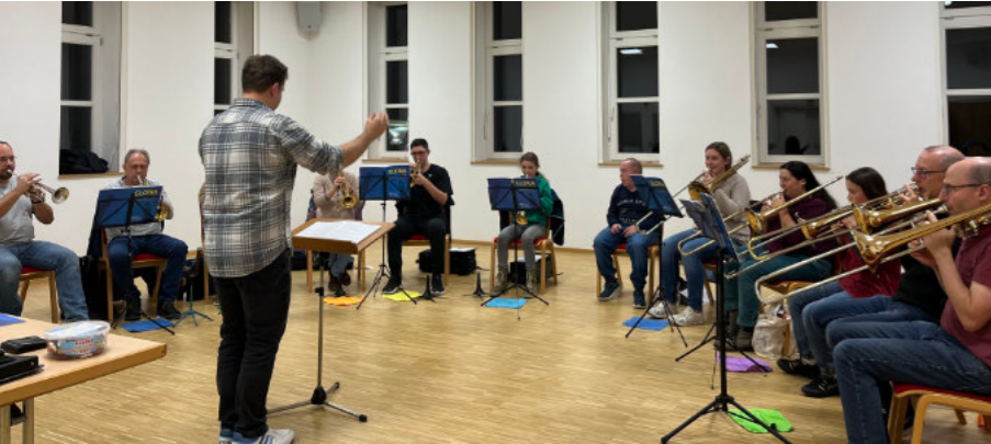
Posaunenchores. Traditionell erklingen am 4. Advent Lieder zum Einstimmen auf Weihnachten. Anlässlich des 25-jährigen Jubiläums des Musikvereins musizieren dieses Jahr die drei Gruppen gemeinsam. Seit Wochen wird fleißig geübt.

Je näher Weihnachten rückt, desto näher auch das alljährliche Weihnachtskonzert des Ev. Kirchenchores und des Ev.