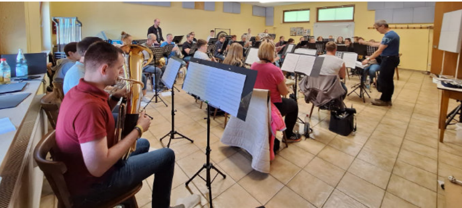
Freuen Sie sich auf bekannte Advents- und Weihnachtslieder zum Zuhören und Mitsingen, sowie Texte, die zum Besinnen kurz vor Weihnachten einladen. Weihnachtskonzert am 22.12.24, 4. Advent um 18 Uhr in der Ev.